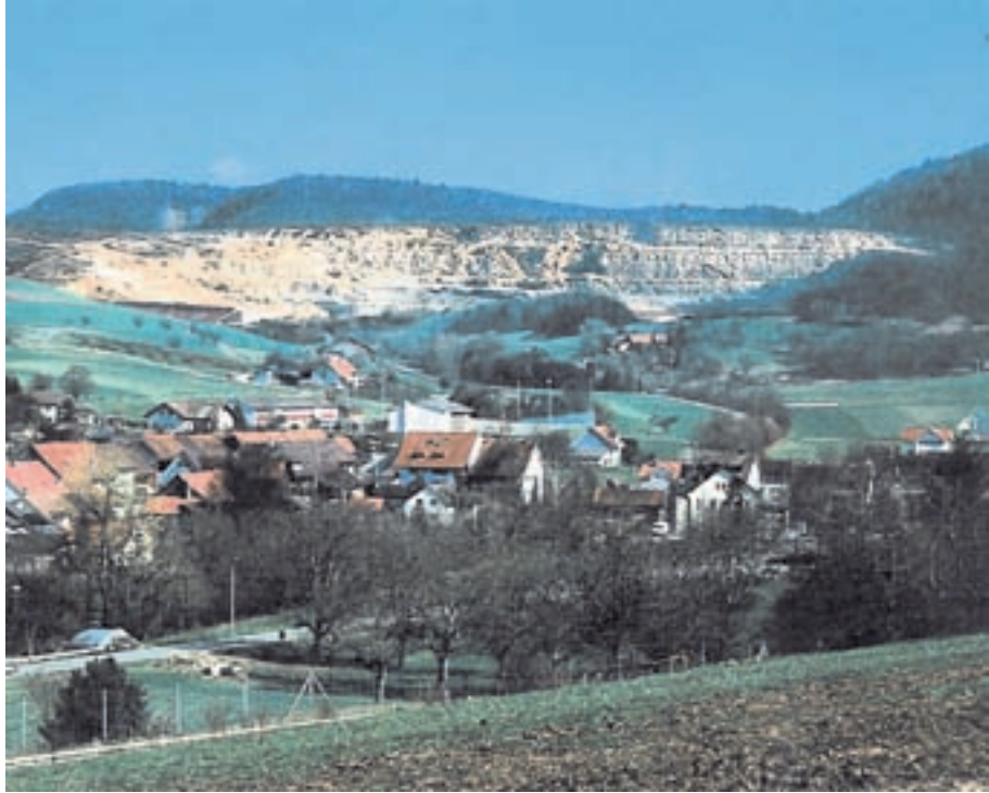
Kampf um einen Berg. Der Bözberg kommt nicht zur Ruhe. Er kommt für Kalkabbau (Bild links), aber auch als Deponie für Atommüll infrage.

Riniken. Fachleute sind sich einig, dass ein Tiefenlager keinen Kalkabbau verträgt