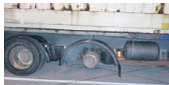
Radlos. Der Fahrer dieses Camions wurde verzeigt.

auf beiden Seiten die Räder fehlten. Die Achse wurde mit Ketten und Spanngurten am Anhänger befestigt, beziehungsweise gesichert. Die Zöllner verweigerten die Weiterfahrt mit dem Anhänger und verzeigten den Fahrer. Trotz massiver Gefährdung der Verkehrssicherheit war sich der Fahrer keiner Schuld bewusst.